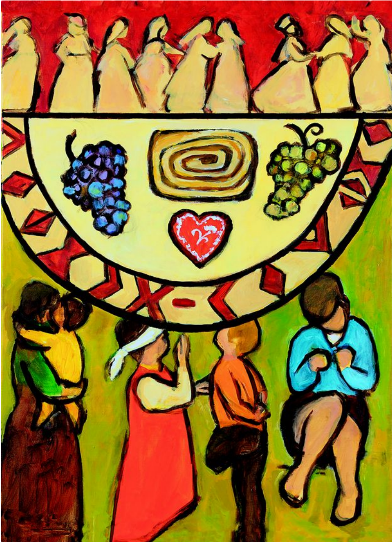
Pfarrbriefservice.de Weltgebetstag der Frauen – Deutsches Komitee e.V. ©